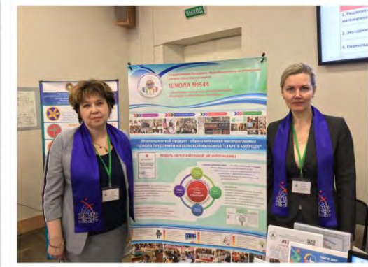
26 марта 2019 года Стендовый доклад "Предпринимательская культура как составляющая новой грамотности" на Межрегиональной научно-практической конференции, пленарное заседание "Успешные практики опережающего внедрения ФГОС СОО"