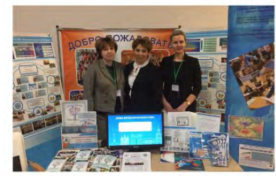
14 марта 2019 года Всероссийский образовательный форум "EDEXPO-2019". Стендовый доклад ГБОУ школы №544 "Предпринимательская культура как составляющая новой грамотности"