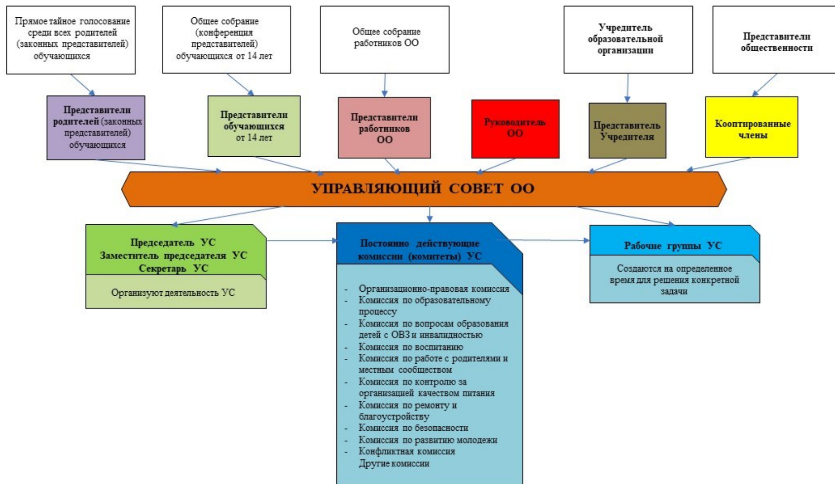
Рис. 1. Модель № 1 – «Управляющий совет общеобразовательной организации» (УС ОО)